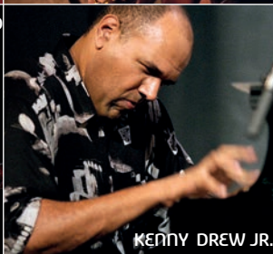
KENNY DREW JR.