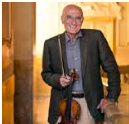
IL VIOLINISTA Salvatore Accardo chiuderà la stagione

«Family to Theatre», oltre a una tessera per 6 spettacoli a scelta «Last Minutes». Particolari riduzioni fino al 30 settembre 2020. Infotel: 900.521.19.08 e su cameratamusicalebarese.it .