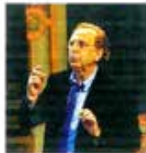
IL DICITORE Michele Mirabella