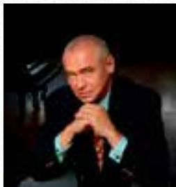
IL PIANISTA Ivo Pogorelich