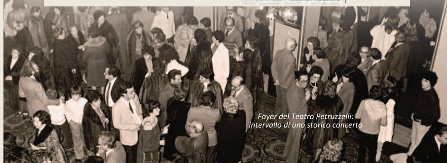
Foyer del Teatro Petruzzelli: intervallo di uno storico concerto

LA GAZZETTA DEL MEZZOGIORNO | 30 ottobre 2014