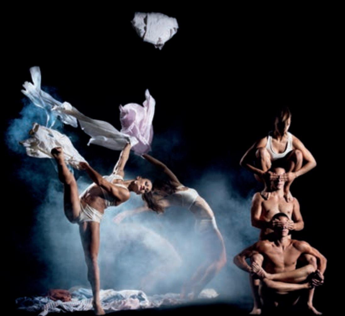
Katakò Athletic Dance Theatre