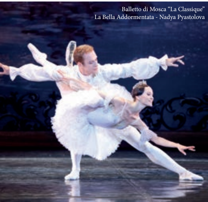
Balletto di Mosca "La Classique" La Bella Addormentata - Nadya Pyastolova