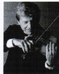
VIOLINO Uto Ughi e ALESSANDRO PREZIOSI