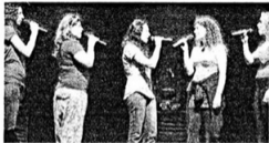
GLI EVENTI Concerto di Capodanno, il 2 gennaio, al teatro Petruzzelli con The Swingle Singers, già ospiti in passato della Camerata