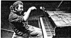
I PROTAGONISTI Grandi nomi in cartellone: dal pianista jazz Stefano Bollani al mito del violino Salvatore Accardo (in basso nella foto)