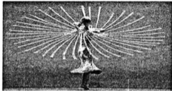
LA DANZA Punta di diamante della stagione della Camerata il ritomo dei Momix in "Remix" il 18 e 19 dicembre al Petruzzelli